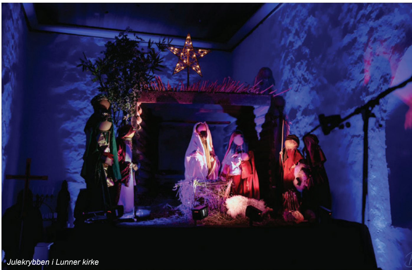
Julekrybben i Lunner kirke