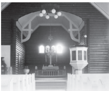
Grua kirke 1924.

Som beskrevet i den flunkende nye jubileumsboka «GRUA. Folk og kirke gjennom 100 år» endte den store dugnadsinnsatsen av lokalbefolkningen med byggingen av Grua kapell (senere endret navn til kirke) med en innvielsesgudstjeneste 21. desember 1924. Det møtte da opp så mye folk at lensmann Elverhøy måtte ordne folkemassen i tre reker – og så gikk biskopen og prestene i spissen for folket opp til Grua kirke!